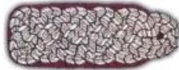
Gemeinde-, Stadt-, Amtswehrführer